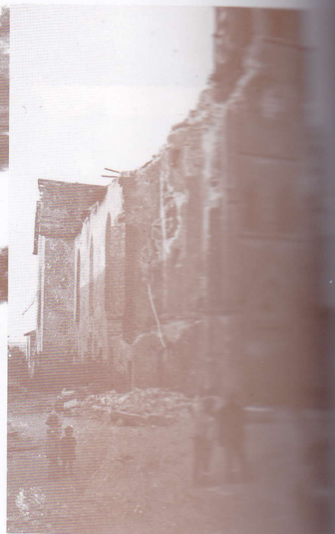
Le clocher de l'église de Malling qui servait d'observatoire aux Allemands est détruit par les Américains en novembre 1944.