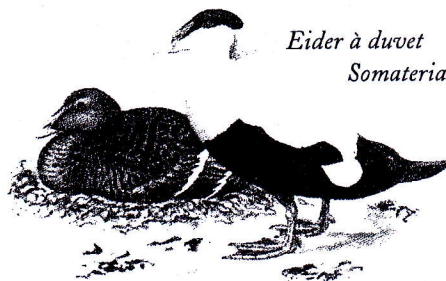
Eider à duvet Somateria mollissima